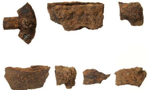
古墳から出土した馬具（左上）他